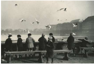
Natascha A. Brunswick Kinder füttern Möwen an der Binnenalster Hamburg, 1930er Jahre Silbergelatine Museum für Kunst und Gewerbe Hamburg