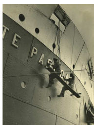
Lotte Genzsch Ohne Titel Hamburg, 1930er Jahre Silbergelatine Museum für Kunst und Gewerbe Hamburg © Nachlass Lotte Genzsch, Hamburg