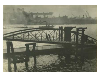
Lotte Genzsch Hafenstimmung Hamburg, um 1932 Silbergelatine Museum für Kunst und Gewerbe Hamburg