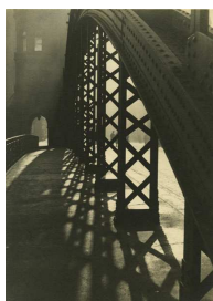
Lotte Genzsch Brücke im Freihafen Hamburg, um 1930 Silbergelatine Museum für Kunst und Gewerbe Hamburg