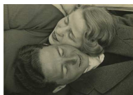
Hildi Schmidt Heins Travemünde, 1938 Silbergelatine Museum für Kunst und Gewerbe Hamburg