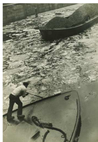
Lotte Genzsch Schwere Arbeit im Fleet Hamburg, um 1930 Silbergelatine Museum für Kunst und Gewerbe Hamburg