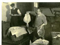
Lotte Genzsch Riesensexemplare in der Fischhalle Hamburg, um 1930 Silbergelatine Museum für Kunst und Gewerbe Hamburg