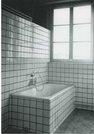
Hildi Schmidt-Heins Bad, um 1942 Silbergelatine Museum für Kunst und Gewerbe Hamburg